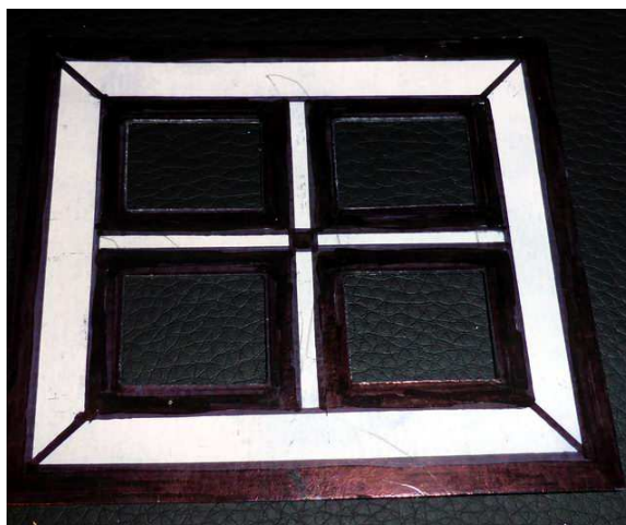
„Okienko” ułatwiające tworzenie szablonów kolorów

Przy pomocy specjalnego „okienka” warto jest przygotowywać sobie szablony kolorów kredek, pisaków, pastelów, kredy, farb itp.